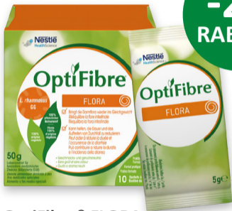
OptiFibre® FLORA Sachetbox 10 x 5g PZN 5361263